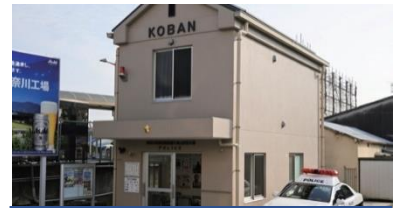
だいうざんえきまえこうばん ③大雄山駅前交番