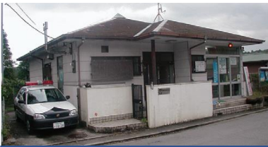
きたあしがらちゅうざいしょ ①北足柄駐在所