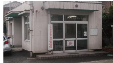
おかもところばん ⑥岡本交番