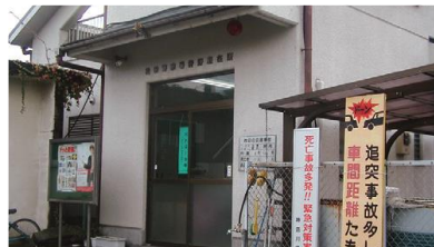
かのちゅうざいしょ ⑤狩野駐在所