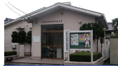
ふくざわちゅうざいしょ ⑦福沢駐在所