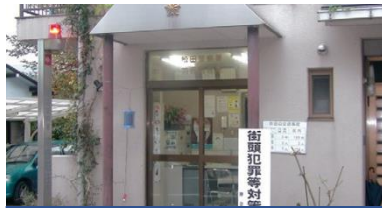
かりのちゅうざいしょ ②苅野駐在所